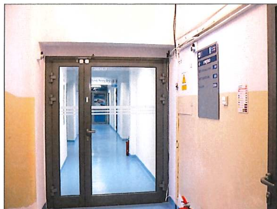
Fot.4 – drzwi ppoż na I piętrze. Tego samego rodzaju są drzwi ppoż. na II piętrze