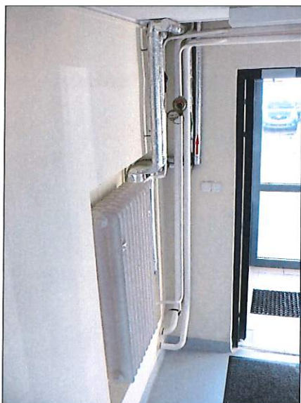
Fot. 7 – Instalacje do obudowy przy drzwiach wejściowych do klatki A