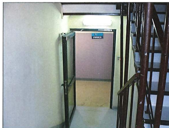
Fot. 2 Drzwi ppoż. - piwnica