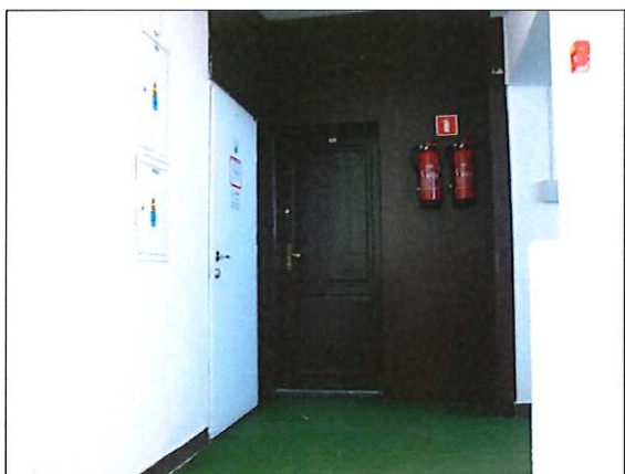
Fot. 5 – Drzwi na III p. do wymiany na ppoż. , do usunięcia palna obudowa na ścianie