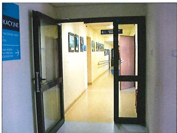
Fot. 3 – Drzwi ppoż. - parter