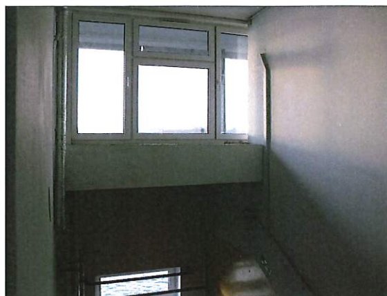
Fot. 6 Okno z profili PCV na III p.