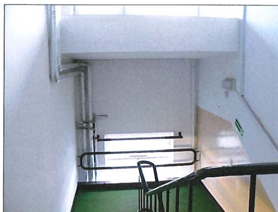
Fot.9 Instalacje sanitarne do obudowy na IIIp