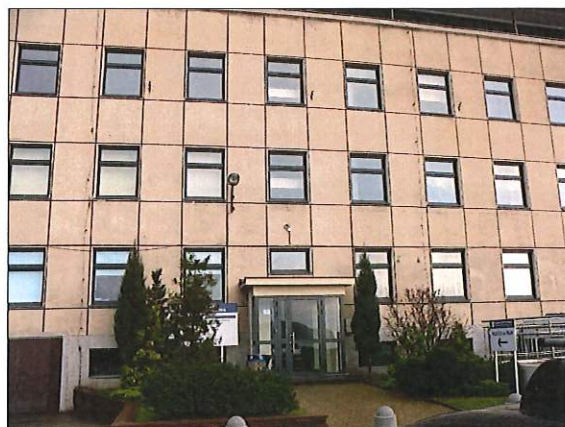
Fot.1 wejście do klatki A